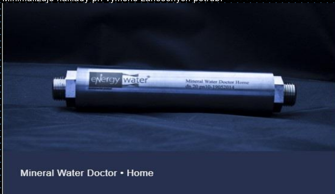
Mineral Water Doctor • Home